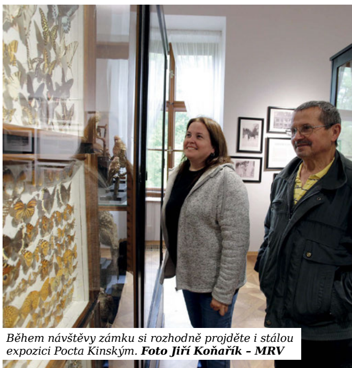
Během návštěvy zámku si rozhodně projděte i stálou expozici Pocta Kinským.

dle otevírací doby - Nová stálá expozice představuje v kontextu dějin dramatické osudy bývalých majitelů zámku rodiny Kinských