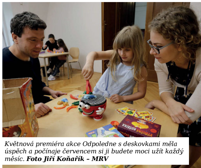
Květnová premiéra akce Odpoledne s deskovkami měla úspěch a počínaje červencem si ji budete moci užít každý měsíc.

10. 8., 13:00-17:00 hodin - Také v srpnu si budete moci užít zábavu a navázat nová přátelství při deskových a venkovních hrách.