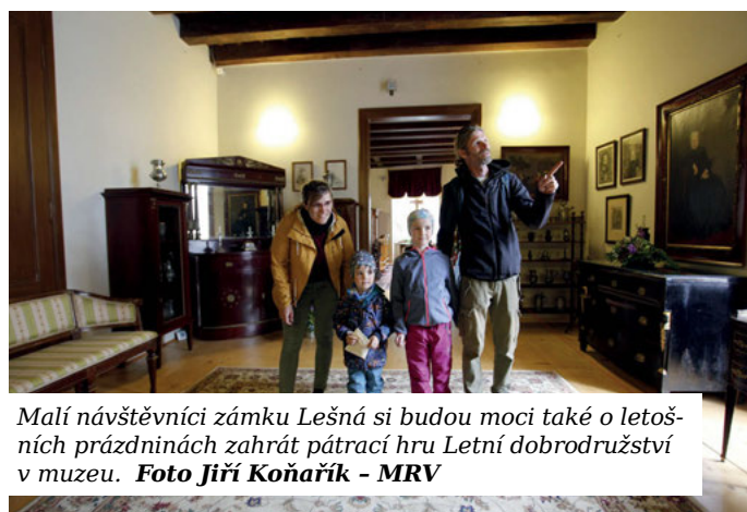
Malí návštěvníci zámku Lešná si budou moci také o letošních prázdninách zahrát pátrací hru Letní dobrodružství v muzeu.

1. 7. - 31. 8., dle otevírací doby zámku - Prázdninové dobrodružství plné stop, hádanek a příběhů ukrytých v zákoutích zámku a přilehlého parku.