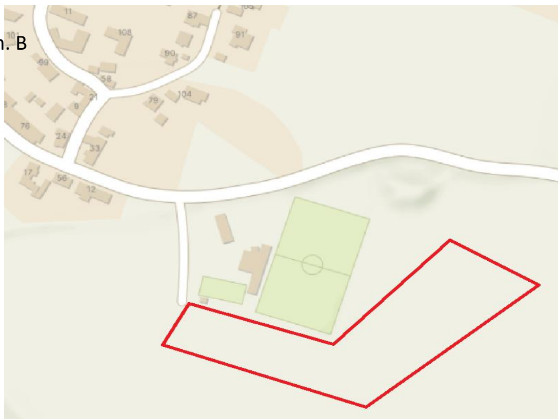
Lhotka n. B

Místa výstavby se mohou měnit z důvodu nepředvídatelných okolností zjištěných při výstavbě.